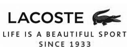
Figura 1. Eslogan de Lacoste

El eslogan engloba toda la historia de la marca, sus inicios y las características de sus productos.