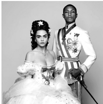
Figura 6. Protagonistas de Reincarnation

El film recrea las vacaciones de Coco Chanel en Austria, pero además agrega momentos claramente ficticios como cuando los personajes de las pinturas cobran vida y empiezan a bailar y cantar a media noche. Quizás un homenaje al imperio Austriaco; ya que Austria fue el país en donde Chanel encontró la inspiración para la chaqueta y donde además se presentó la colección 2014/2015, inspirada en la época austriaca reflejada en el film .