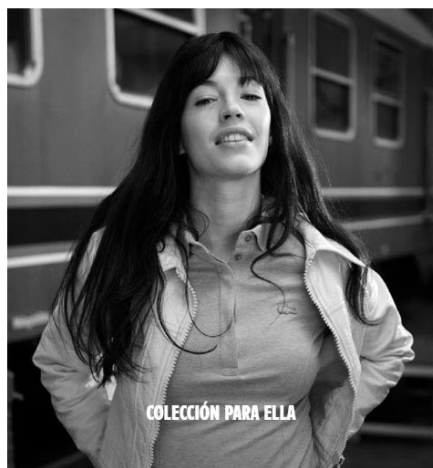
Figura 2. Imágenes de la colección Lacoste

El producto dentro de este fashion film funciona como complemento de la historia, realmente no desempeña un rol importante para el desarrollo de la misma.