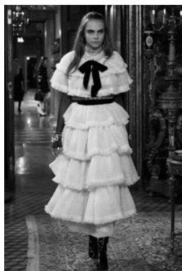
Figuras 7 y 8. Piezas de la colección del desfile Chanel 2014/2015