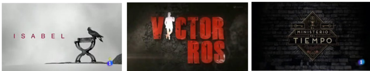
Imagen 4. Logos de las series Isabel , Victor Ros y El Ministerio del tiempo

Al observar la cabecera de Isabel resulta relevante esa ausencia de rótulos durante la pieza. El único texto que presenta es el propio título de la serie, lo que demuestra la intención apuntada anteriormente de desconexión total entre el mundo real y el creado. Algo que contrasta con Victor Ros o El Ministerio del tiempo , imagen 4.