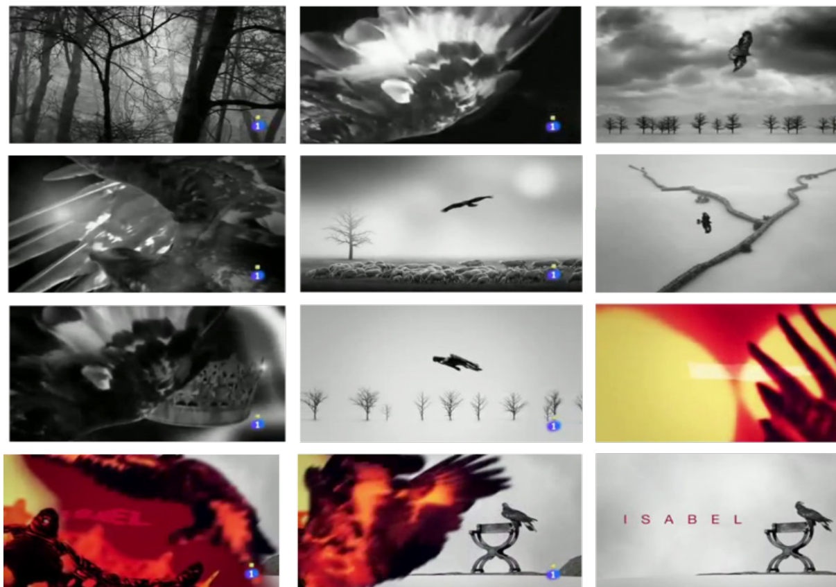
Imagen 2. Fotogramas del opening de Isabel

La elección de los tamaños de plano en los tres fragmentos resulta significativa. Continuando con las ideas aportadas por Millerson (1991) y Castillo (2016) sobre el poder persuasivo que posee la cámara y el significado que transmite una imagen en función de su tamaño, se ha estudiado la composición de los planos. A través del equilibrio de los planos utilizados en el genérico de Isabel — cinco de ellos son planos detalle y los otros seis son amplios— se puede dilucidar la doble vertiente inherente a la narrativa del relato. Por un lado, se presenta la visión histórica del transcurrir de los hechos desde un punto de vista neutro e impersonal, mientras que, por otro, se muestra la parte más interna e íntima de la vida de la protagonista como se puede ver en la imagen 2.