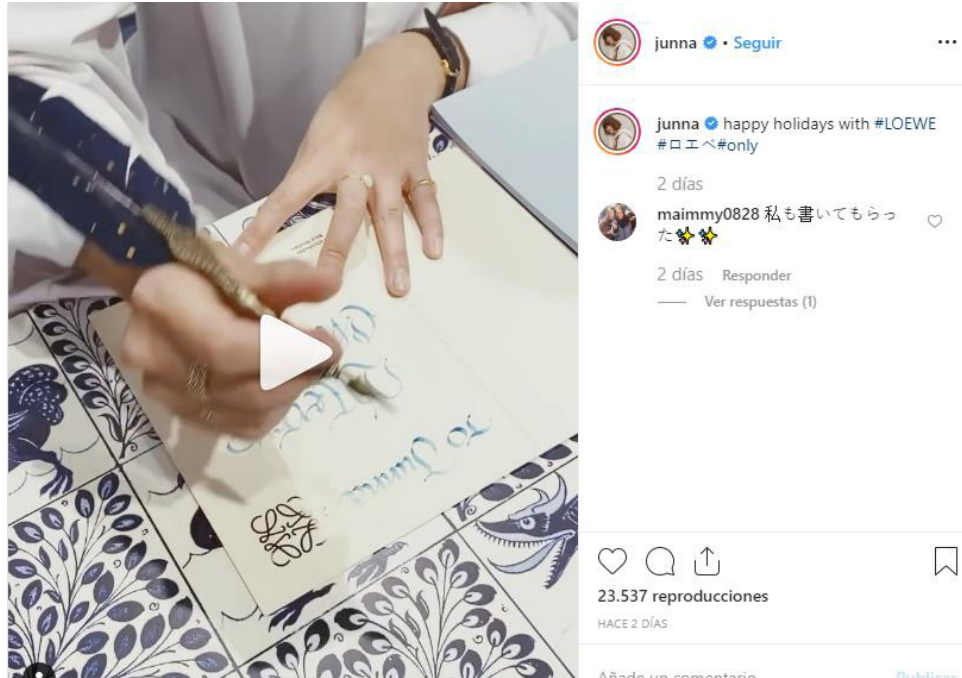
Imagen 1. Objetivo del post : potenciar la identidad de marca en Loewe

Como muestran los porcentajes de resultados (Tabla 3), los posts publicados se concentran en la promoción de la marca y del producto por delante del influencer . Destacan los mensajes dirigidos a reforzar la imagen de marca en Gucci (58.8%) y en Loewe (56,3%), mientras que en Margiela es el producto, el ítem, que concentra la máxima atención del post (80%).